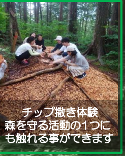
チップ撒き体験 森を守る活動の1つにも 触れる事ができます