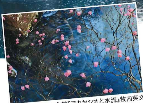
商工会賞『アカヤシオと水流』牧内英文